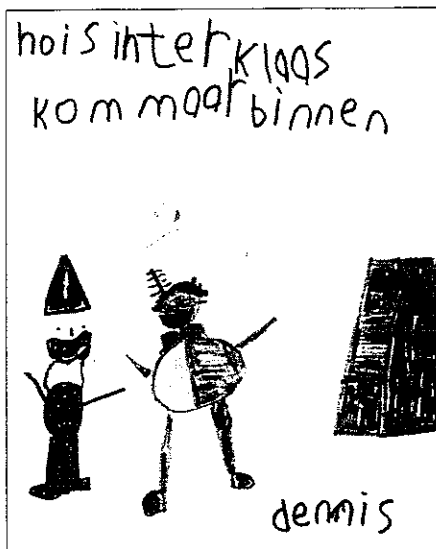
Teken- en schrijfproductie van Dennis

Het voorbeeld illustreert hoe een simpel verzoek om hulp aanleidingen biedt tot betekenisvolle communicatie rond geschreven taal en tot leerervaringen bij kinderen. Kinderen zijn zeer gemotiveerd om bij het probleem van de rijmpiet te helpen. En dat de activiteit voor hen nog niet is afgelopen, blijkt de volgende morgen.