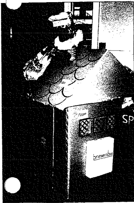
Onderdeel van de themahoek van Sinterklaas.